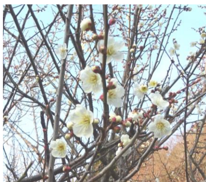
通学路に咲く梅の花