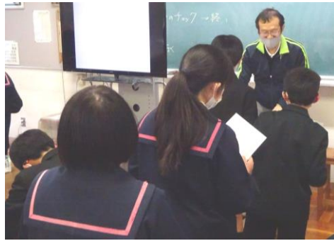
6年2組は技術の授業

以前、本通信の中で小中一貫「光井学園」について書いたことがあります。光井小学校と光井中学校が一つの「学園」として子どもたちの豊かな学びを支えていくためには、小学校から中学校へのなめらかな「接続」ということは欠かせません。俗に「中一ギャップ」という言葉で表されるように、中学校進学後、学習や環境の大きな変化に