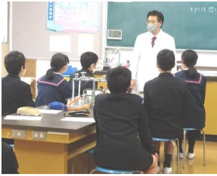
6年1組は理科の授業

三月一日に、来年度入学予定の光井小六年の児童を迎えて、授業体験が行われました。体育館で全体説明を行った後、理科と技術の授業を体験してもらいました。最初は緊張した表情をしていた児童たちも、授業が進むにつれて、だんだんとリラックスしてきたようで、教師の問いかけに元氣よく答えを返したり、積極的に活動に取り組みだりする姿が見られました。