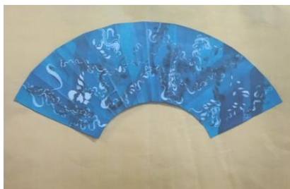
↑山口県学校美術展覧会平面の部入選 ←伊藤左千夫短歌大会伊藤左千夫賞 明るい選挙啓発作品入選→