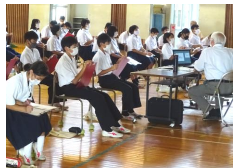
光井の歴史・通史編