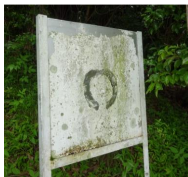
上、右、左、下、見えません……