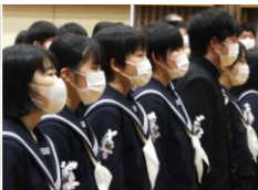
合唱「旅立ちの日に」