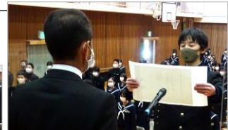
卒業生から学校に【テント】を!