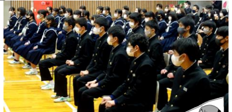
緊張した面持ちで2年生が式に出席しています 【1年生は教室でリモートでの参加】