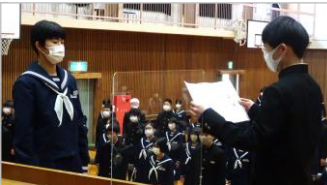
在校生から卒業生に【印鑑】を!