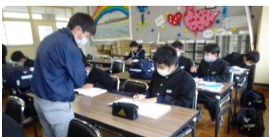
顧問の先生が見守っています