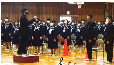
1.2年合唱『正解』の練習に熱が入ります