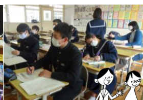
それぞれの委員会で3年生が輝いていました