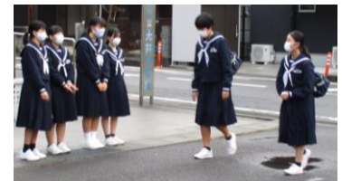
マスク越しに笑顔で出迎えます