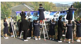
(上) 生徒会役員が取り付けしています (右) 横断幕を間近で見えています

生徒のデザインをもとに作成した『生徒会目標の横断幕』が完成し、先日、生徒昇降口前のネットに取り付けました。これから、より生徒会目標を意識した生活ができそうです。〈夢を現しよう〉