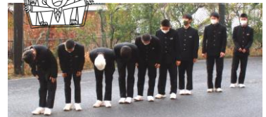
3年生男子を中心に気合いが入ります