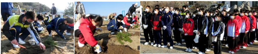
～マツの成長が楽しみです～

新宮地区の海岸で行われた「マツの植栽ボランティア」に、進路が決ま った3年生を中心に、30名の生徒が参加しました。当日はとても暖かく、参 加した生徒は、地域の方と一緒に、額に汗をにじませながら進んで活動して いました。