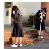
～参加した生徒たち～