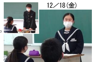
～委員長のみなさん、お疲れ様でした～