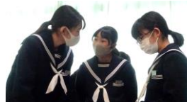
自分のことを話しています