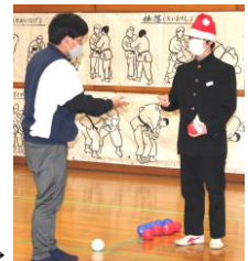
教員とジャンケンですー

12/15(火)午前 柔剣道場でゲームを行い、小中の児童生徒で楽しい時間を過ごすことができました。