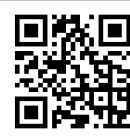
教務通信「笑顔」の バックナンバーはこちら！

★保護者の皆様、この一年間、様々な面でサポートいただき、ありがとうございました。年末年始と慌ただしい時期になります。どうぞ、ご自愛ください。