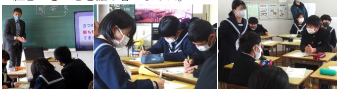
大型テレビを使用 自分の考えを書いています グループの意見を発表

コロナに関する差別・偏見をなくすため、自分たちが取り組むべきことを話し合いました。