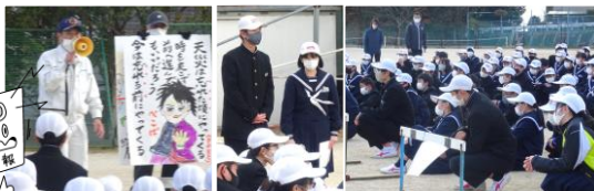
絵を使っの説明 謝辞と司会を行った2年生 しっかり聴いています

非常ベルが鳴り響き、緊急放送でグラウンドに集合しました。グラウンドでは、光市自主防災組織アゾバイザーさんのお話を熱心に聴きました。