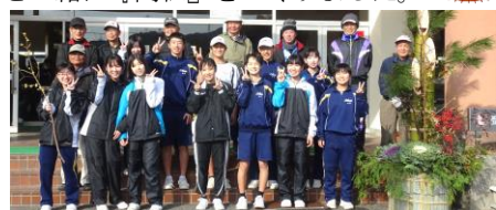
(最後に全員で記念写真)