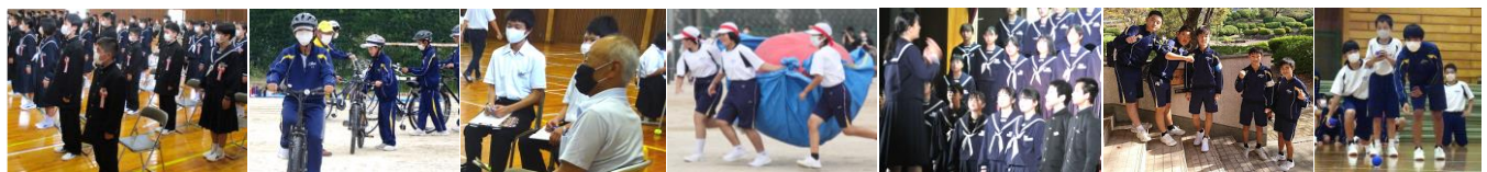
4月:入学式 5月:1年交通教室 5月:2年職業講話 9月:体育祭 10月:文化祭 11月:3年学年行事 11月:クリスマス

令和3年が、生徒のみなさん、保護者の皆様にとって輝かしい年になりますよう、心より祈っています。