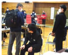
おじいさんと中学生を演じています

授業参観の後には小中の教職員と地域の方でグループをつくり、授業について話し合いました。教職員と地域の方が一緒になって授業について話し合うことは初めてでしたが、様々な立場から率直な意見が飛び交い、有意義な時間となりました。