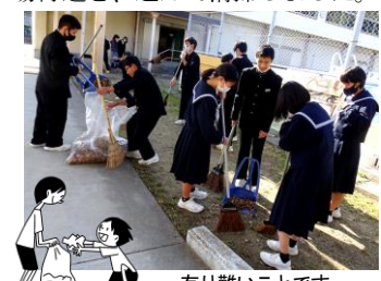
～有り難いことです～