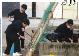
1年生は池掃除です