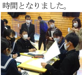
多くの参観者が見守るなか、積極的に話し合っています