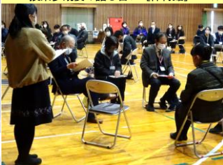
協議内容を発表中です