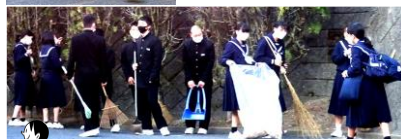
大量の落ち葉を集めています

3年生のボランティア生徒と委員と一緒に掃除を行っています。池の掃除を主体的に行っている生徒もいます。