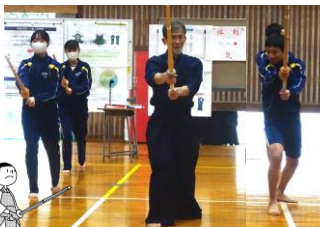
堂々とした構えです