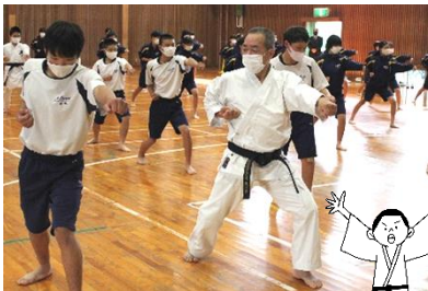
アドバイスを受けながら演じています

講師の先生のご指導のもと、底冷えする体育館で、生徒たちは気合いを入れて型を演じました。 11/26(木)