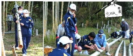
運んでいます 地域の方と一緒に切っています

門松で使う竹の切り出しを、陸上部と男子卓球部の生徒が地域の方と一緒にを行いました。 11/28(土)