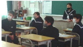
委員長が委員会を引っ張っています