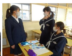
高校生活について話が聴けました