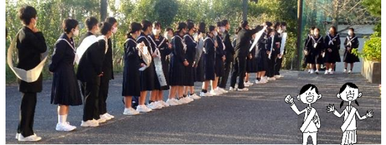
先週の選挙運動の様子です

12月になり、朝晩の寒さが身にしみる時季となりました。先週、定期テスト3が終わり、生徒はじっくりと授業に取り組んでいます。また、3年生は三者懇談が終わり、学習に対する意欲が一段と向上してきたように感じます。今週の火曜日に生徒会役員選挙が終わり、新生徒会長、執行書記が決まりました。令和3年に向けて、準備が整いつつあります。今年も残すところ、あと3週間余りです。新しい年へ思いを馳せながら、みなさんが自分らしく、今年を『有終の美』で締めくくることを願っています。