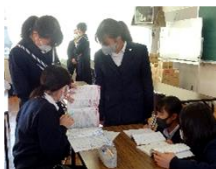
質問に的確なアドバイスをもらっています