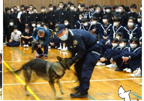
麻薬探知犬がハンドラーと遊んでいます