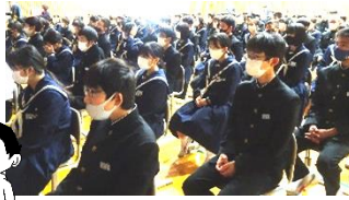
凛とした態度で聴いています

限られた時間でしたが、『薬物には一度たりとも手をだしてはいけない』、『甘い誘いには十分に注意することが必要である』など、多くのことを学ぶことができました。