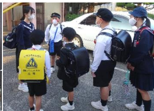
光井小で振り返りです