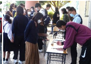
【引き渡し】引き渡し者の確認です

●非常の事態に備え、朝は小学生と一緒に登校し、下校は保護者へ引き渡しを行いました。 ～保護者、地域の皆様、ご協力いただき、ありがとうございました～