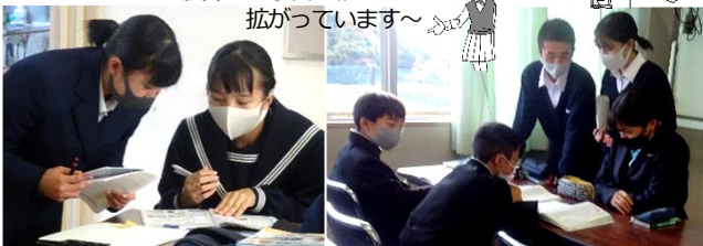
高校生の説明を納得しながら聞いていました【次回の放課後学習会は12/3(木)です】