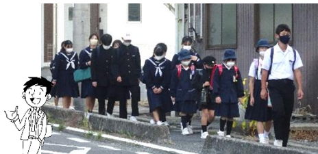
【集団登校】中学生が先頭と最後尾を歩きました