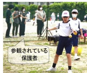
参観されている保護者