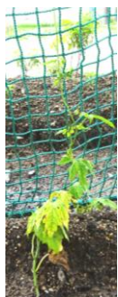
確実に成長しています。【緑のカーテン】

TOPICS 生徒が登校する時間に挨拶をしていると、マスク越しに大きな挨拶が返ってきます。なかには、会釈しながら挨拶をする生徒、立ち止まって挨拶をする生徒もいます。朝から元気をもらっています。先日、ある生徒がまじめな顔で「先生、パワーをください」と言ってきました。いつも生徒から元気をもらっている分、元気を与えることができる教員集団でありたいと思います。