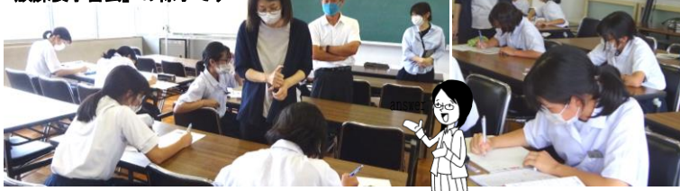
「放課後学習会」の様子です