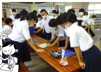
1階ホールにてクイズ結果を集計中