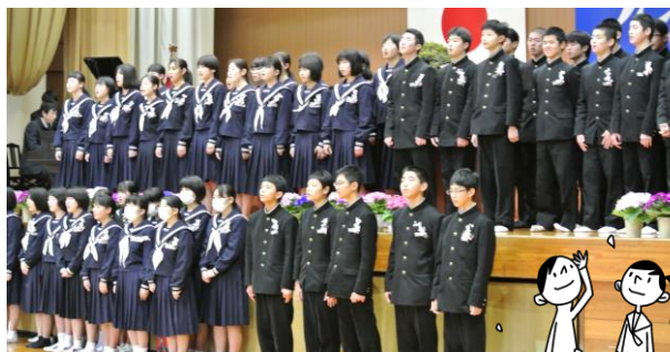
学年合唱「ベストフレンド」

3月7日(土)、「第73回卒業証書授与式」を行い、59名の卒業生が巣立ちました。休校に伴い、在校生、来賓の方の出席はありませんでしたが、思い出に残る卒業式にと、内容を工夫して行いました。卒業生は校長先生から一人ひとり卒業証書を受け取り、大きな声で「旅立ちの日に」を歌いました。式の後には、保護者の前で「ベストフレンド」を歌い、保護者と教職員の温かい拍手に送られ退場しました。