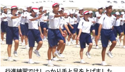
行進練習ではしっかり手と足を上げました