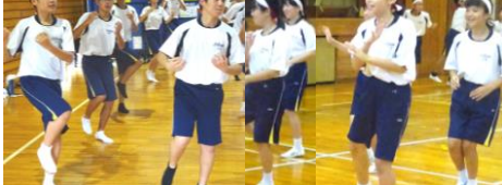
応援練習に熱が入っていました