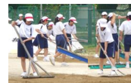
グラウンド整備行いました