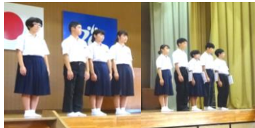
表彰された生徒に大きな拍手を送っています