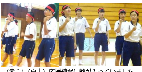
(赤↑)(白↓) 応援練習に熱が入っていました