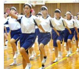
練習初日の行進はバッチリ

8月30日(金)から始まった体育祭練習も、日を追うごとに充実したものになってきました。練習では、応援リーダーが中心となって、隊員に指示を出しながら活動しています。なかでも、隊ごとの応援練習では、夏休みに応援リーダーが考えたダンスを教え合いながら行っており、見ていてとても楽しそうです。また、要所要所で各リーダーが隊員に、上級生が下級生に指示を出しながら引っ張っている姿を見ると、とても頼もしく感じます。いよいよ明後日が体育祭です。天候が崩れないことを願いつつ、生徒のみなさんが最後まで元気よく練習に取り組み、当日はかけがえのない一日になることを期待しています。