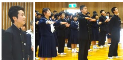
壮行式での様子です