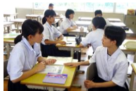
学年ごとに話し合っています

放課後に専門委員会を行いました。どの委員会も積極的な話し合いが行われ、5月の振り返りをもとに、6月の目標を決めました。