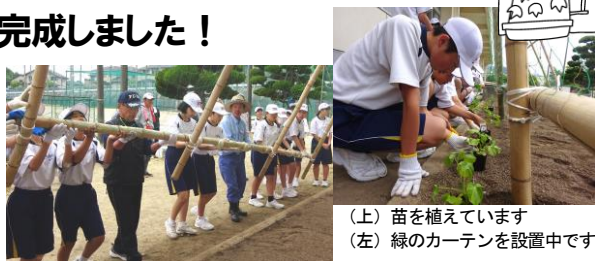
(上) 苗を植えています (左) 緑のカーテンを設置中です

午前中に1年生が「緑のカーテン」を設置しました。当日は11名もの地域の方のアドバイスを受けながら、土づくりから始めて、緑のカーテンの作成・設置、そして最後はゴーヤとアサガオの苗を植えました。一生懸命に活動した1年生のみなさん、お疲れ様でした。これで暑さが防げます。