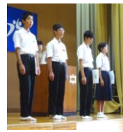
表彰された友達です→

「おはようございます」体育館に集まった全校生徒が大きな声で挨拶を行いました。健康観察の後の表彰では、表彰を受けた生徒に、全校生徒が大きな拍手をしてその功績を讃えました。