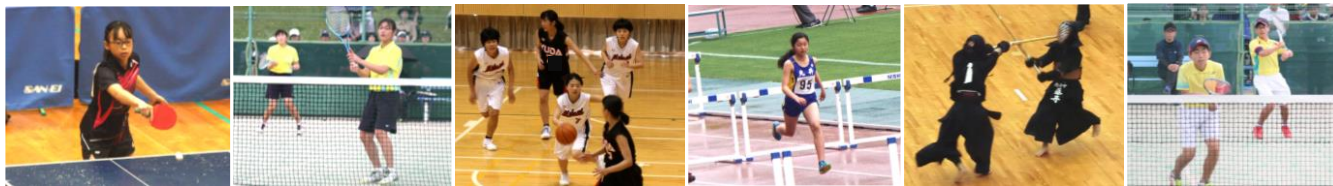
卓球 [光市総合体育館]

18日(土)、会場に緊張した面持ちで選手が集まりました。開会式の後、競技の始まりです。選手たちは、今年度初めての県大会で、出だしは少し緊張があったようですが、戦いが進むにつれて、もてる力を存分に発揮していました。結果は下の通りです。出場したみなさん、お疲れ様でした。よく頑張りました。また、応援して下さったみなさん、ありがとうございました。