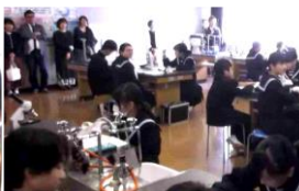
1年B組 理科 顕微鏡を使いました