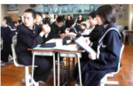
2年A組 音楽 歌い方を追究しました