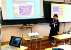
しらうめ学級 個人で発表をしました