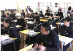
2年B組 国語 聞き取りを行いました