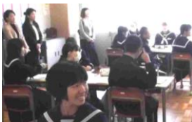
1年A組 国語 「のはらうた」を学びました

～授業参観～ 1年生と2年生は担任による授業、3年生は体育館で保護者会を行いました。