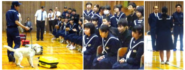
(左から) 麻薬犬が麻薬を発見・真剣に見る生徒・生徒代表お礼の言葉