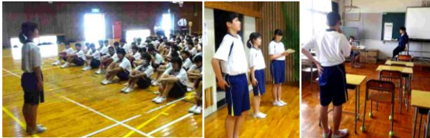
(左から) 保健委員長の話・全体会を進行する保健委員・視力検査